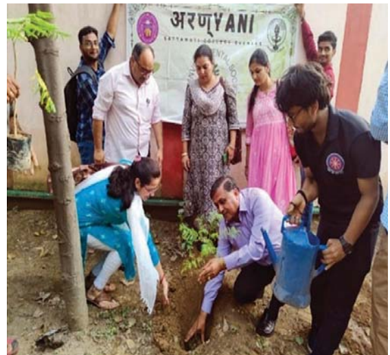
Glimpse of various activities organized by Eco-Club Aranyani (The Environmental Society)